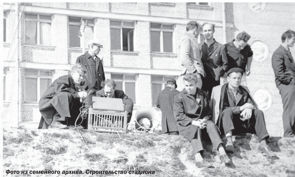
Строительство стадиона