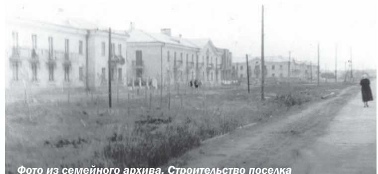
Строительство поселка