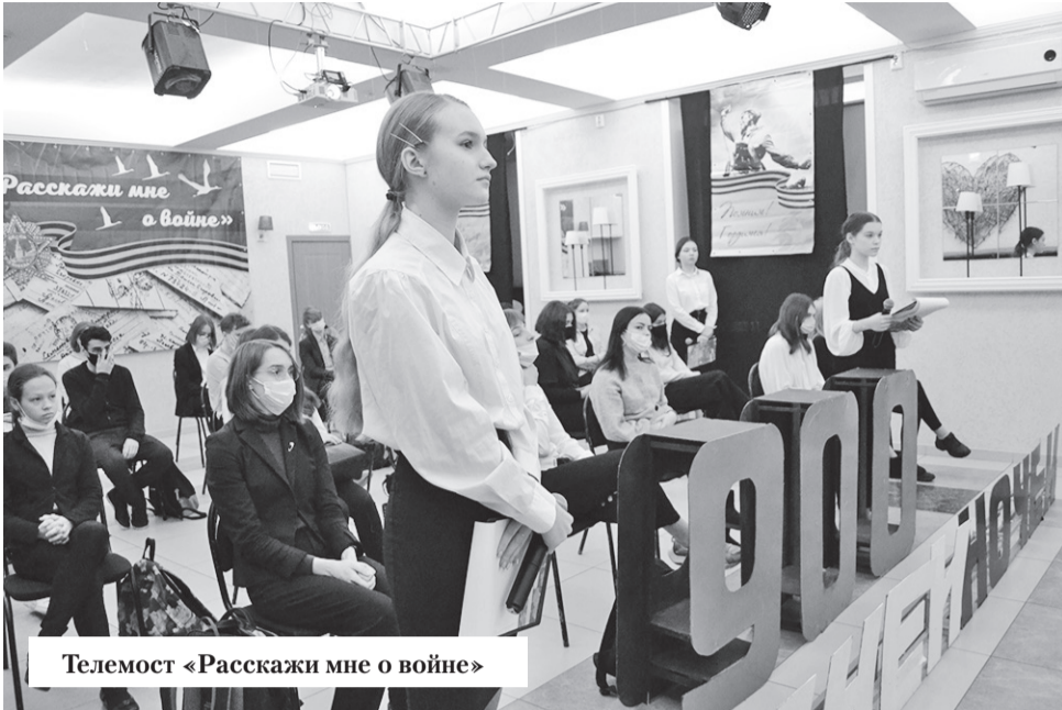
Телемост «Расскажи мне о войне»