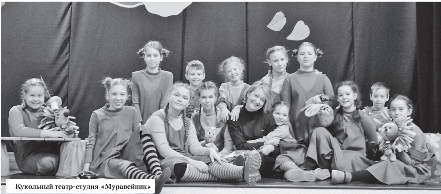
Кукольный театр-студия «Муравейник»