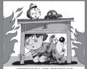
НИКОГДА НЕ ПРЯЧЬСЯ ПРИ ПОЖАРЕ!