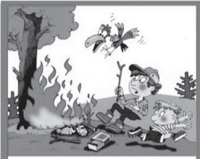
ИГРАТЬ С ОГНЕМ В ЛЕСУ ОПАСНО!