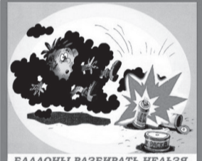
БАЛЛОНЫ РАЗБИРАТЬ НЕЛЬЗЯ, ОНИ - ОГНЕОПАСНЫ!