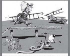
ПОЖАРНЫЕ НА СОРЕВНОВАНИЯХ