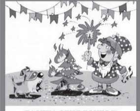
БЛОЧКА ОГНЯ ВОИТСЯ!