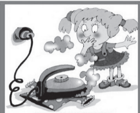
ОПАСНО ДОВЕРЯТЬ ЭЛЕКТРОПРИБОРЫ ДЕТЯМ!