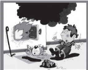
НЕ ОТКРЫВАЙТЕ ДЕТИ ДВЕРЦУ ПЕЧКИ!