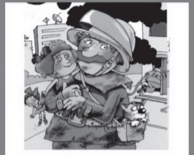
ПОМОЩЬ ПРИДЕТ ВОВРЕМЯ!