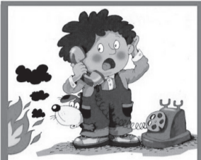
ПРИ ПОЖАРЕ ЗВОНИТЬ 01