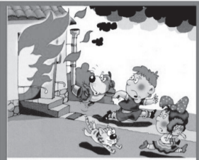
ПРИ ПОЖАРЕ СЛЕДУЕТ СРОЧНО ПОКИНУТЬ ПОМЕЩЕНИЕ!