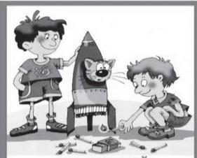
ГРОЗИТ БЕДОЙ ИГРА СО СПИЧКАМИ!