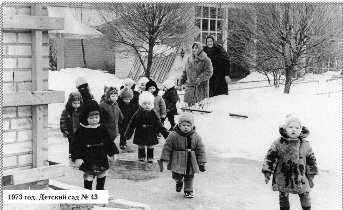
1973 год. Детский сад № 43