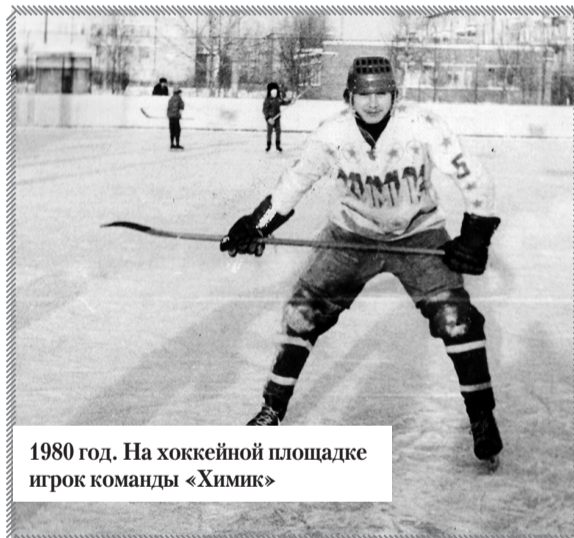
1980 год. На хоккейной площадке игрок команды «Химик»