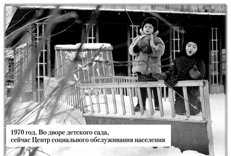
1970 год. Во дворе детского сада, сейчас Центр социального обслуживания населения