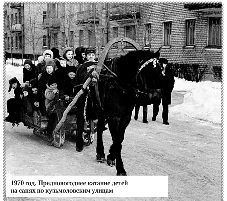
1970 год. Предновогоднее катание детей на санях по кузьмоловским улицам