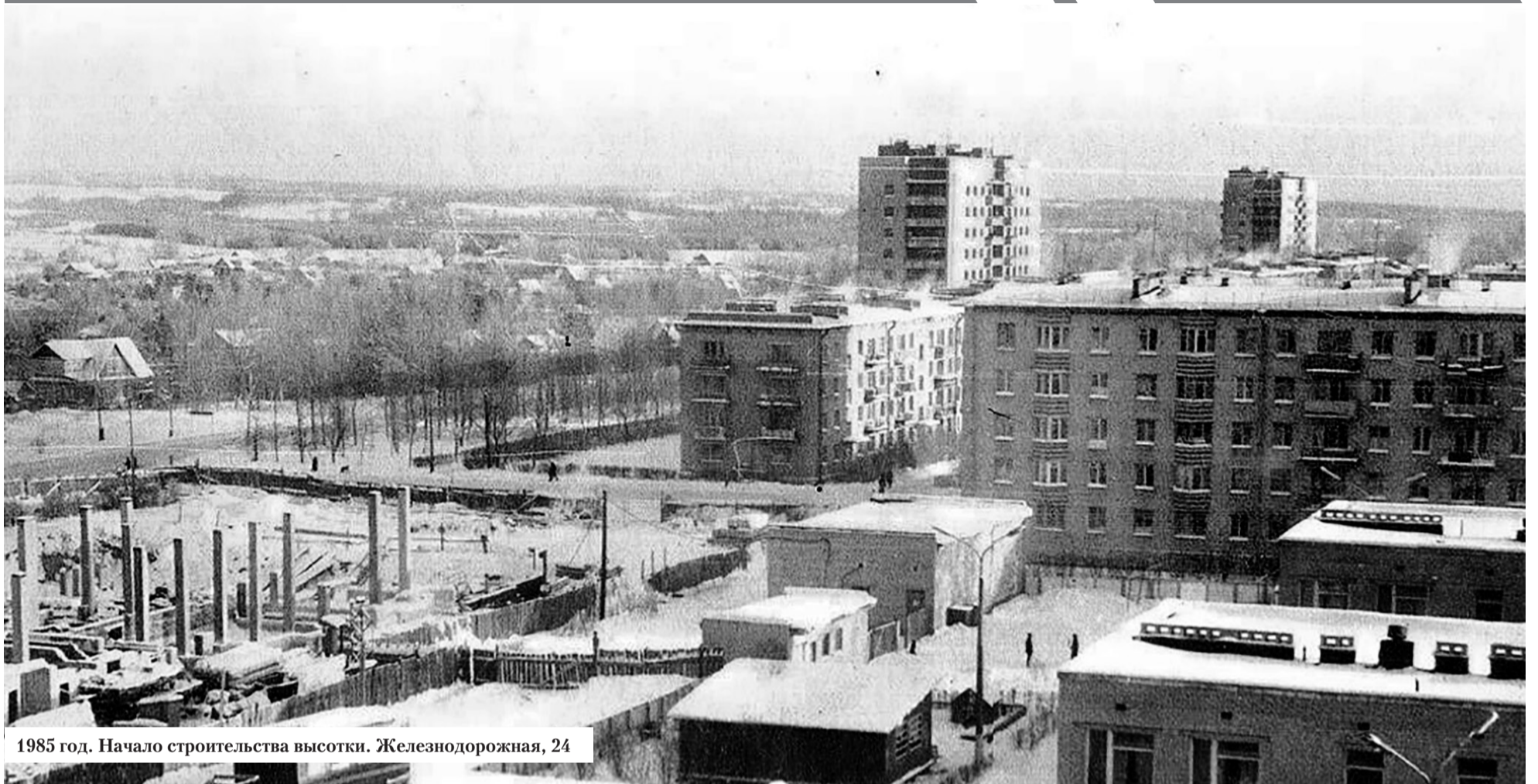
1985 год. Начало строительства высотки. Железнодорожная, 24