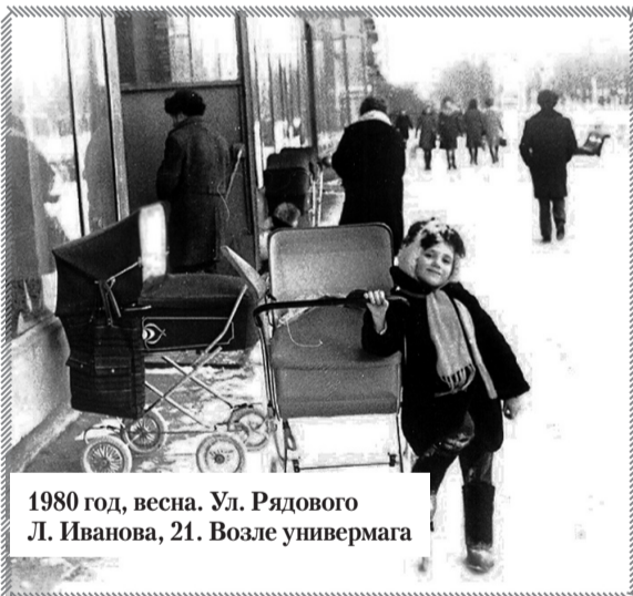
1980 год, весна. Ул. Рядового Л. Иванова, 21. Возле универсама