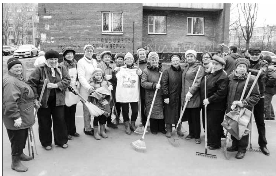
Экологический субботник «Зелёная весна»