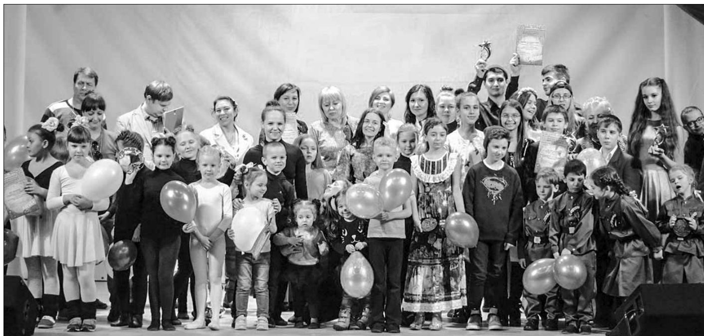
Фестиваль талантов «Кузьмоловская звезда»

Для привлечения молодых специалистов в учреждения здравоохранения и образования совместно со Всеволожским муниципальным районом были выделены новые квартиры молодым педагогам и врачам. Также в декабре кузьмоловские депутаты вручили ключи от новых квартир жителям, стоящим на очереди по программе улучшения жилищных условий. Вообще, в нашем поселении проводится много мероприятий, как муниципальных, так и областных, объединяющих всех жителей