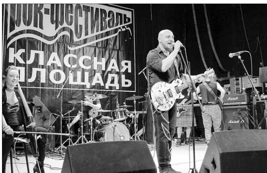
Рок-фестиваль «Классная площадь»