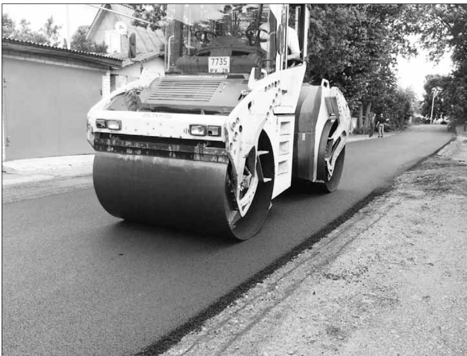
Асфальтирование улицы Садовой

– Стоит отметить, что минувший год стал рекордным для нашего поселения по многим параметрам, начиная от объёмов выполненных работ