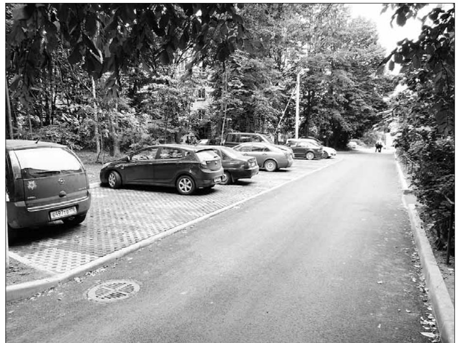
Автомобильная парковка для жителей улицы Молодёжной