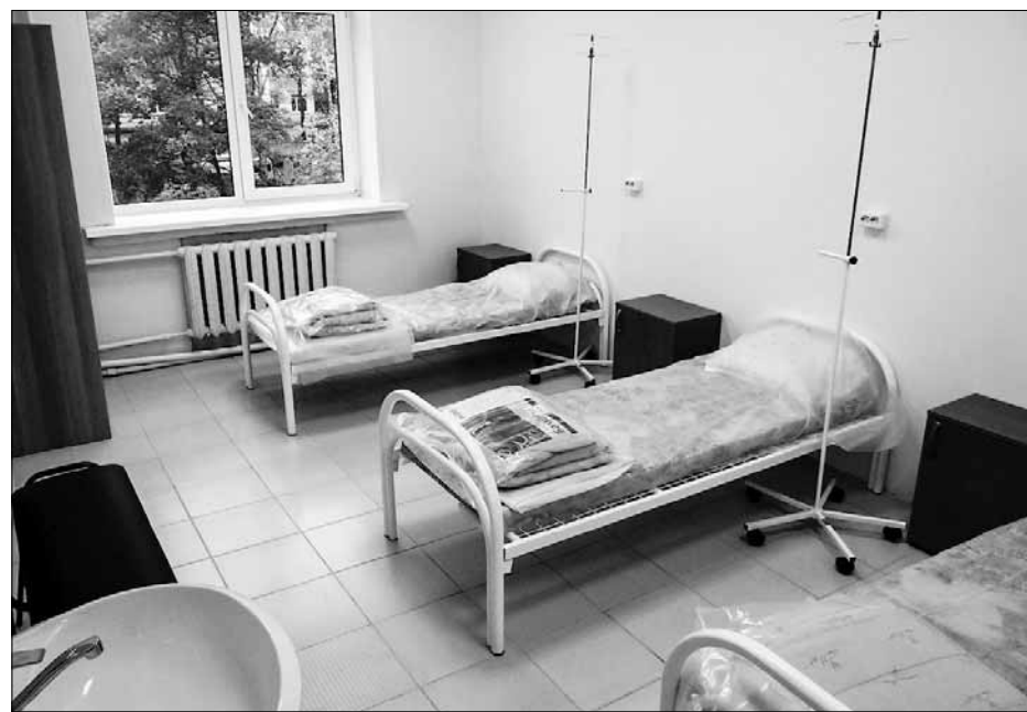
Дневной стационар в Кузьмоловской поликлинике