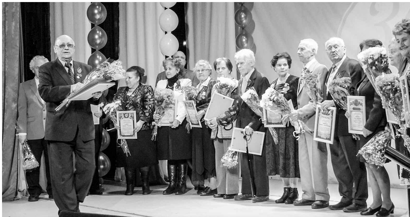
30-летний юбилей Совета ветеранов МО «Кузьмоловское городское поселение»

– Перейдем к социальной и спортивной сфере. Что значимого в этих направлениях произошло