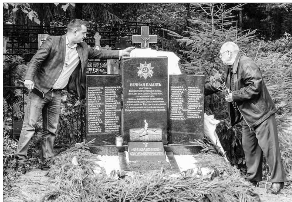
Открытие мемориала на Токсовском кладбище

Кузьмолово, и привлекающих таланты из города и района.