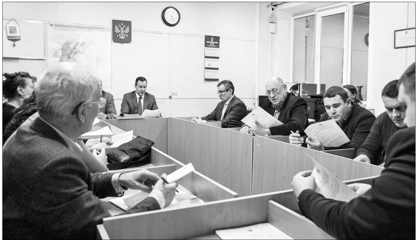
Заседание совета депутатов

деревне Куялово произведён ремонт участка дороги на улице Межевой. Напомню, что за текущий год на территории поселения организацией ЛОЭСК проведены масштабные работы по замене и прокладке новых электрических сетей для обеспечения надёжного электроснабжения. Для теплоснабжения домов на улице Заозёрной они были подключены новой теплотрассой от блочно-модульной котельной № 2.