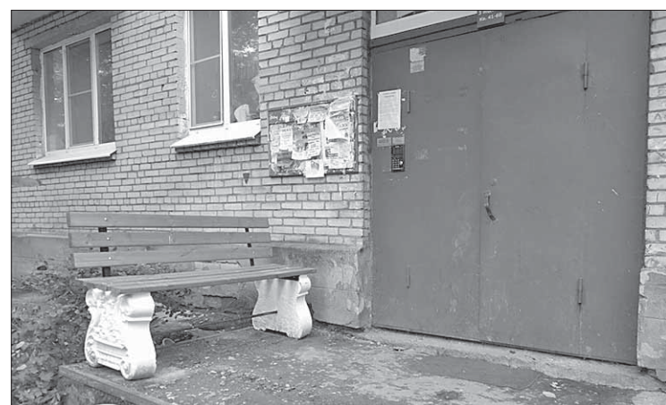
У подъездов установили новые скамейки

К малым и очень важным архитектурным формам также можно отнести и ограждения газонов и палисадников. В летнее время заборы приводили в порядок: выравнивали, очищали от ржавчины и красили, где-то устанавливали новые. И за лето же в некоторых местах заборы успели пострадать от лихачей-водителей. Например,