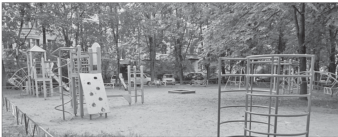
В сентябре провели ревизию и ремонт детских игровых площадок

на улице Победы ограждение было основательно помято именно наехавшей машиной. В сентябре сломанный забор отремонтировали.