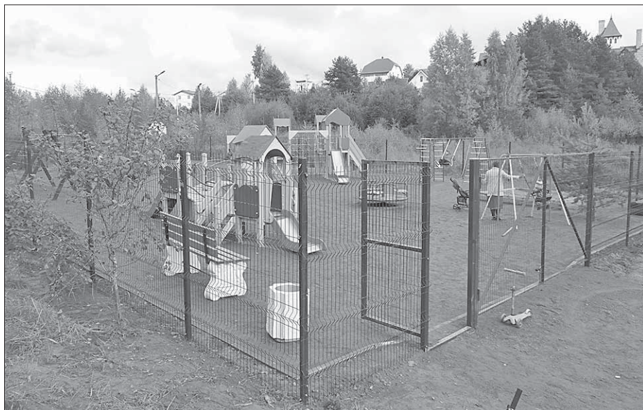
Установлено новое ограждение детской площадки в Куялово