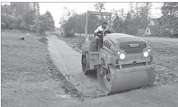
Возле магазина «Дикси» появилась пешеходная дорожка

В первой половине сентября завершено обновление разметки поселковых дорог общего пользования. Новую разметку получили пешеходные переходы и автомо-