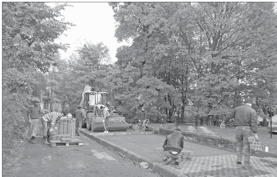
На улице Школьной создана автомобильная парковка