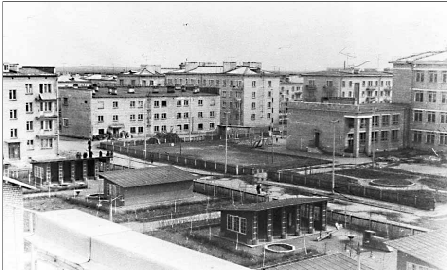
Первые панорамы Кузьмолово

Чаще всего это делали заключённые в ночное время. Они разгружали вагоны, в которых находился цемент, щебень, уголь, доски, кирпич и другие строительные материалы. Стройматериалы перегружали в автомобили. Объёмы были гигантские – шофёры в две смены развозили груз по строительным площадкам. На строительстве было