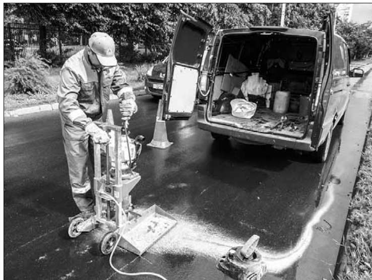
Отбор проб асфальта на ул. Л. Иванова