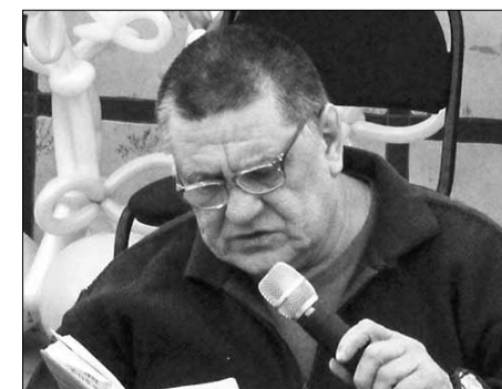
Олег Карпухин Лето

Расцветала яблонька раннею весной Шептала солнышку: «Ты побудь со мной! Каждый мой цветочек плод подарит людям Наливное яблочко, отличное на вкус. И всем нам будет радостно в Преображенье Господа Наш урожай отменный во храме освятить!»