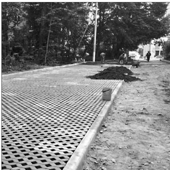
Новая парковка на улице Железнодорожной