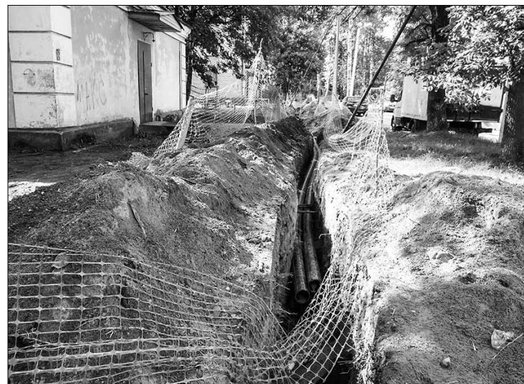
Замена сетей на Школьной улице

Не канула в Лету тема уличного освещения. На участке улицы Юбилейной – от Короткого переулка до Ленинградского шоссе – будет произведён ремонт наружного освещения. Здесь электрики заменят порядка километра кабеля и установят девять современных