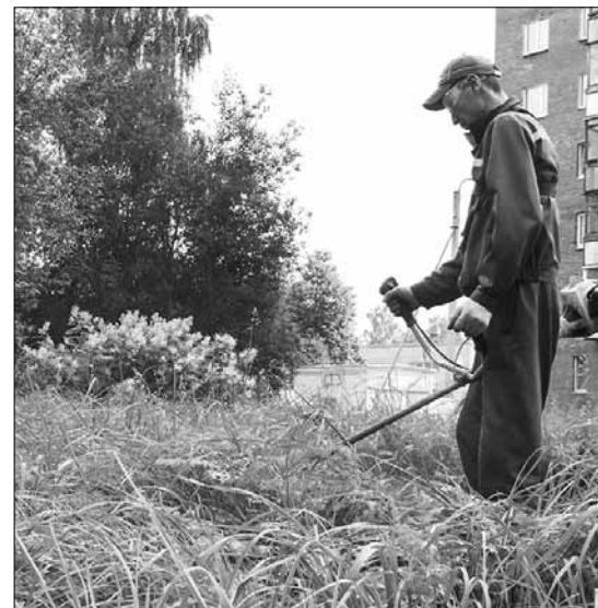
Скашивание травы во дворе на улице Строителей