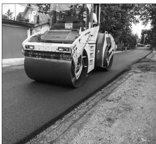
Ремонт дороги на ул. Садовой

От дорожной темы перейдём к придомовым проблемам, которые, увы, накопились за долгие годы в Кузьмолово. Многие дворы требуют настоящей перестройки, а не только благоустройства. И дело тут не только в том, что за дворами практически не следили. Большинство кварталов поселения были построены в советское время, когда автомобильный парк был существенно меньше. В те годы с проблемами тех же самых стоянок и гостевых парковок не сталкивались, не требовалось столько машино-мест маленькому посёлку. Теперь количество моторов выросло, и вопрос надо решать. Равно как и решать проблемы пешеходных дорожек, газонов, детских площадок и многие другие.