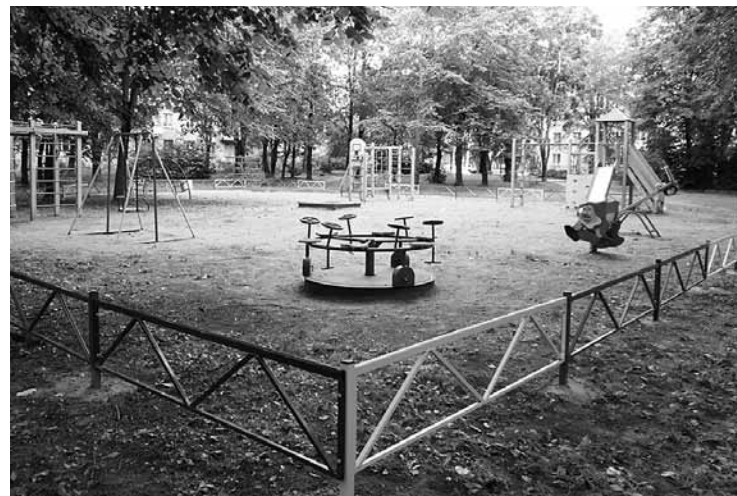
Ограждение не даст парковаться на детской площадке на ул. Победы, 11

Первый этаж. Отремонтирован коридор административного