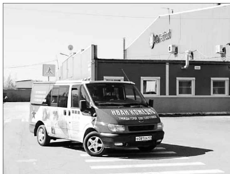
Собственный развоз персонала

Вопрос продвижения по служебной лестнице был и остаётся важным в любой организации. Компания предоставляет и та-