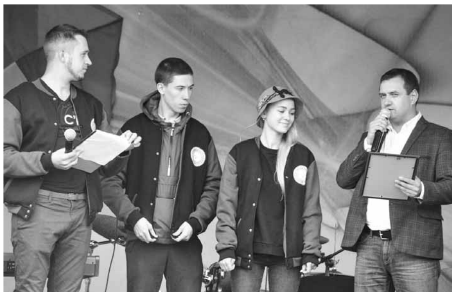
Поздравление активистов Молодёжного совета

Кузьмоловская молодёжь отметила свой праздник