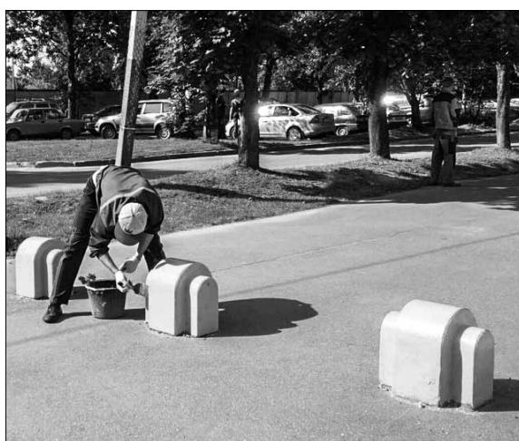
Покраска ограждений на ул. Л. Иванова

Отметим, что все дорожные работы должны закончиться в ближайшие дни. Готовность и силы у специалистов дорожной службы есть, равно как и готовность администрации выполнить надлежащий контроль и приёмку. Всё зависит только от погодных условий