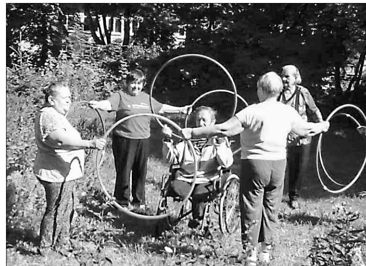
День физкультурника в ЦСО

Здесь всё интересно и красиво! Каталая резная горка, ветряная мельница, купеческий и гостевой дома, дома ремесленников. Очень интересные ручные поделки, поэтому мы отправились по мастерским набираться опыта для нашего мастер-класса. Новые идеи не купишь, но подсмотришь. Из посадских красивых платков можно сшить платье, пончо, курточ-