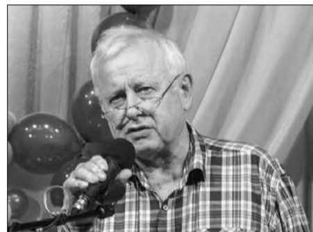
Лев Дмитриев Встаёт молодая Россия

Проходят годы, но никогда Дни рабства от войны разве забудешь. Бессмертный полк и ветеран труда, Ты вечно жив и вечно с нами будешь.