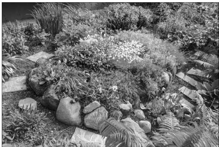
Очаровательный цветник на Юбилейной, д. 32