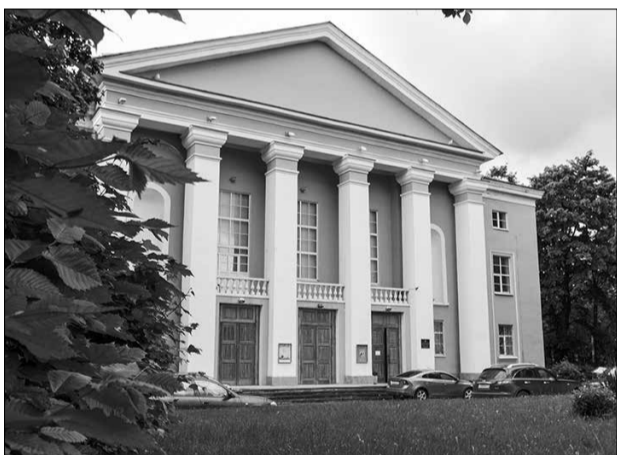
Дом культуры к ремонту готов

В будущем сотрудничество с ведущей отечественной экологической организацией продолжится. В планах – участие в проектах, направленных на повышение уровня экологической культуры, просвещение и образование жителей нашего муниципального образования.