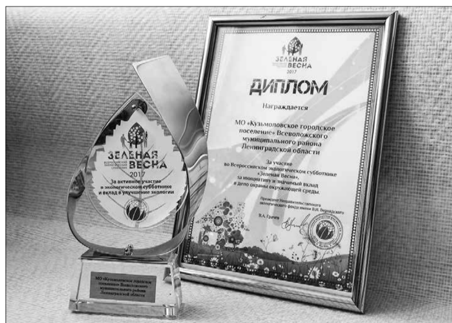
Благодарность фонда им. Вернадского заняла особое место среди почётных знаков отличия Кузьмоловского городского поселения

Награждение прошло 5 июня в Москве, в Администрации Президента РФ, в рамках торжественной церемонии, посвящённой празднованию Дня эколога. Именно во время награждения стали понятны масштабы акции. Оказывается, в адрес организационного комитета пришло почти 2000 отчётов о проведённых экологических мероприятиях в рамках субботника «Зелёная весна». Среди участников были такие промышленные гиганты, как ПАО «Газпром», Госкорпорация «Росатом», ГМК «Норильский Никель», «Роснефть» и «Татнефть». В итоге в Москву для награждения были приглашены чуть больше 30 самых активных участников субботника из 25 различных регионов Российской