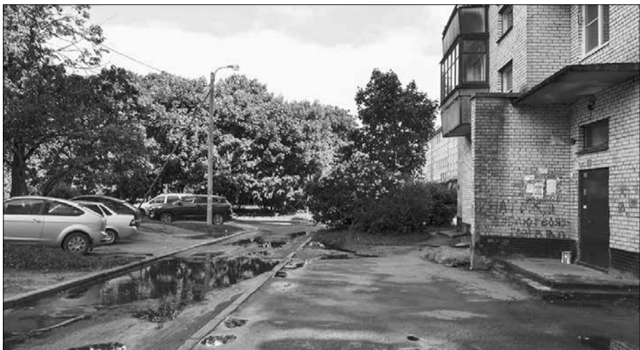
На улице Леонида Иванова, д. 25 проведут благоустройство двора и проезда