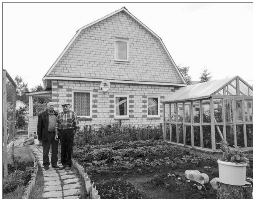
В конкурсе «Ветеранское подворье» есть первые номинанты

В номинации «Декоративно-прикладное творчество» от участников ожидают творческого воплощения замысла и искусства выполнения декоративно-прикладных работ.