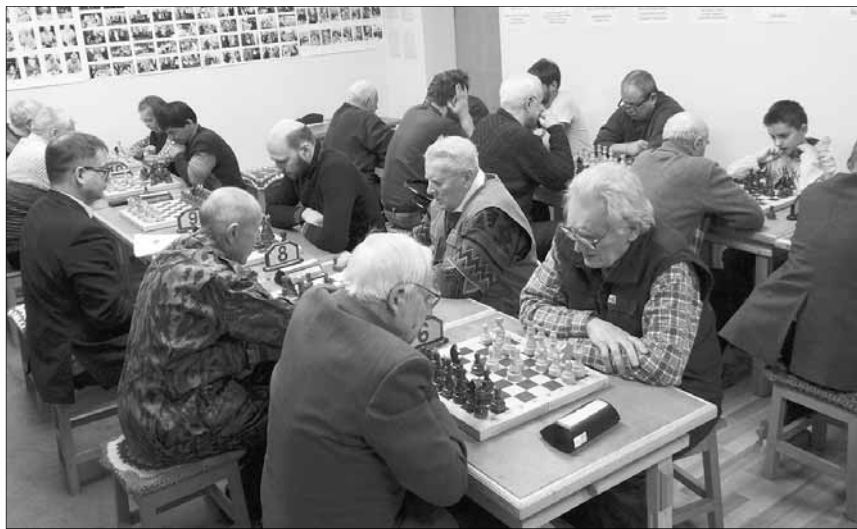
Праздничную игру посвятили дню рождения клуба

Шахматный клуб «Кузьмолово» отпраздновал день рождения. 9 февраля общественной организации исполнилось четыре года. Основные празднования прошли в воскресенье, 5 февраля, во время очередного турнира.