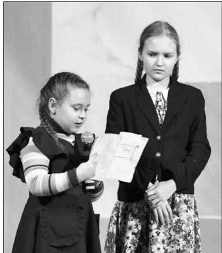
Во время постановки школьницы читали блокадные дневники