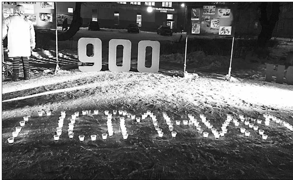
Траурная цифра «900» знакома всем ленинградцам