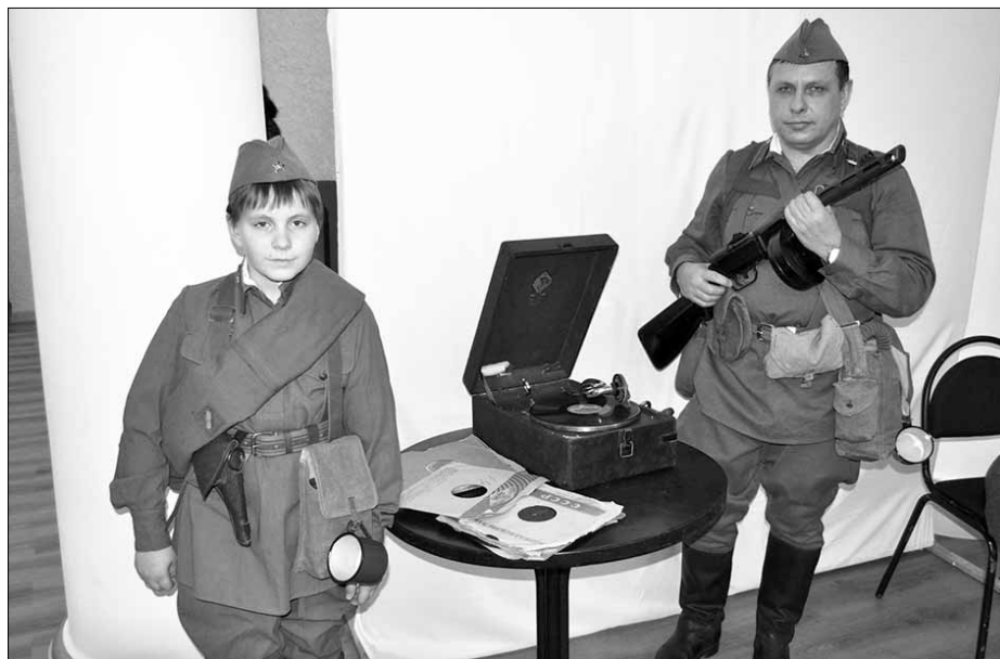
Гостей концерта встречали «бойцы РККА»