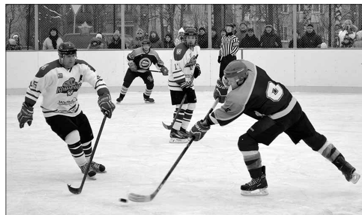
Встреча «Химика» с «Коммунаром».

Напомним, что первая мужская команда по хоккею появилась в Кузьмолово 44 года назад и получила имя «Заря». В дальнейшем первая сборная из посёлка химиков и строителей стала основой для современной команды «Химик», которая по сей день отстаивает спортивную честь Кузьмолово на областных чемпионатах и первенствах по хоккею. Впервые День хоккея состоялся в Кузьмолово в 2013 году и с тех пор является одним из наиболее любимых и массовых местных праздников.