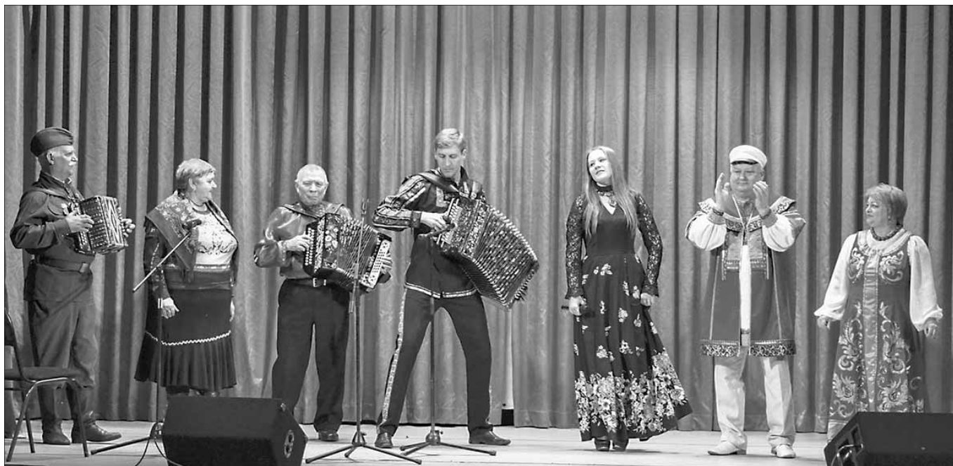
Русская гармонь окрыляет

В Кузьмоллово состоялась череда праздничных мероприятий, посвящённых очередной годовщине снятия блокады Ленинграда. Это была действительно череда концертов, поздравлений, акций и поездок, состоявшихся под эгидой Дня воинской славы – Дня снятия блокады Ленинграда. В Кузьмолловском городском поселении выступали гармонисты, читали блокадные дневники, поздравляли и общались с жителями блокадного города, вручали ленточки Ленинградской Победы, рассказывали стихотворения и пели военные песни, расставляли памятные свечи и прокладывали теломосты на Дальний Восток России.