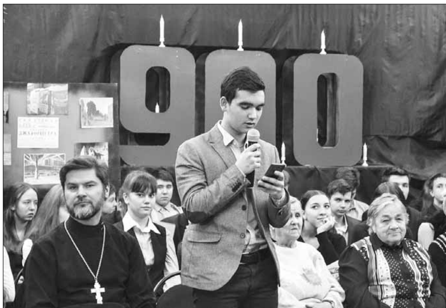
Участники телемоста получали символические СМС

приятия «Анком» и «Росхлебпродторг». Руководство трёх компаний в очередной раз показало высокую степень социальной ответственности кузьмоловского предпринимательства, приняв личное участие в комплектации подарочных наборов и организации праздничных мероприятий.