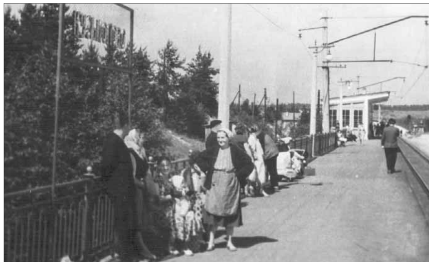
Станция «Кузьмолово» в 1962 году