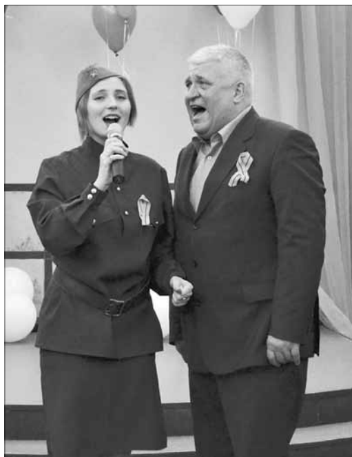
Песни военных лет